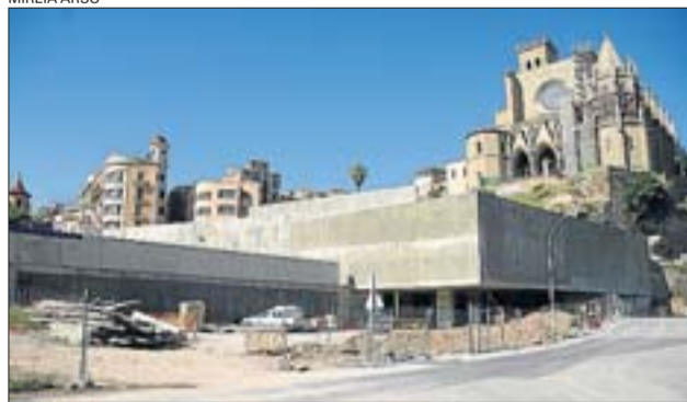
El pàrquing de la Reforma, encara inacabat, al peu de la Seu