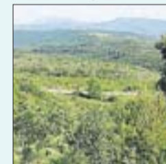
Bosc a Castelltallat

Els experts creuen que la situació dels boscos cremats quan arribin a edat adulta serà pitjor que els que el foc va engolir ara fa 10 anys. Avui, 18 de juliol, es compleix una dècada del darrer gran incendi forestal, el del Bages i del Solsonès, que va començar a Aguilar i va arribar a les portes de Solsona. »Pàg. 2 a 5