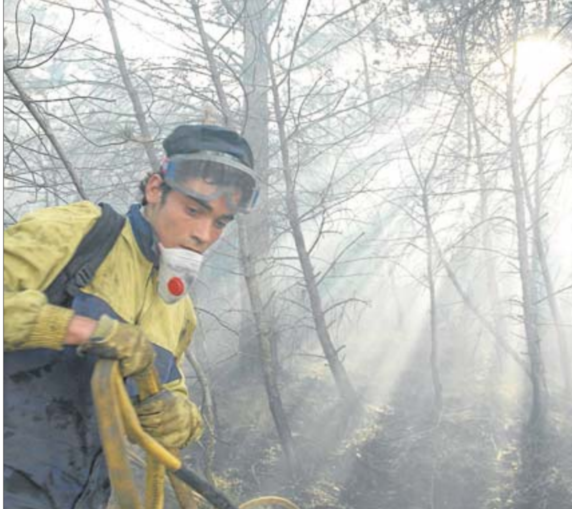
Un jove apagant foc en un dels nombrosos incendis que l'estiu passat van afectar el Bages

gen dels grans focs forestals és l'acumulació de combustibles, que es dona, sobretot, per un procés d'abandonament històric de la gestió forestal —a causa de la manca de rendibilitat—, la ramaderia extensiva i el conreu. Aquest tècnic troba previsible que la tendència continuï els propers 20 anys. Així, el risc de propagació va en augment, mentre que la capacitat d'extinció no pot créixer il·limitadament. També s'ha de tenir en compte l'increment de la po-