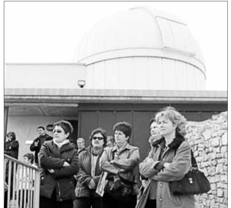
Visitants a l'observatori astronòmic de la serra de Castellatallat