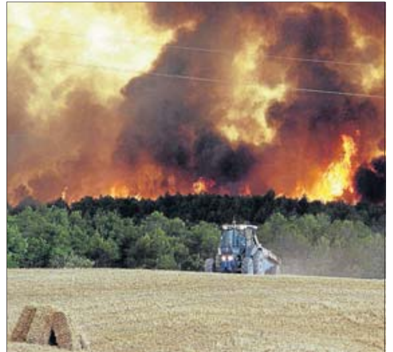
L'incendi es va originar a Aguilar de Segarra i va devastar 27.000 hectàrees