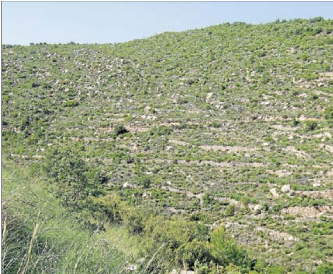
Estat actual del bosc de Castelltallat que es va cremar el 1998 i que no s'ha regenerat ni replantat