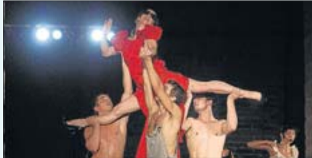
Un moment de la coreografia «Lligat a pedaços»