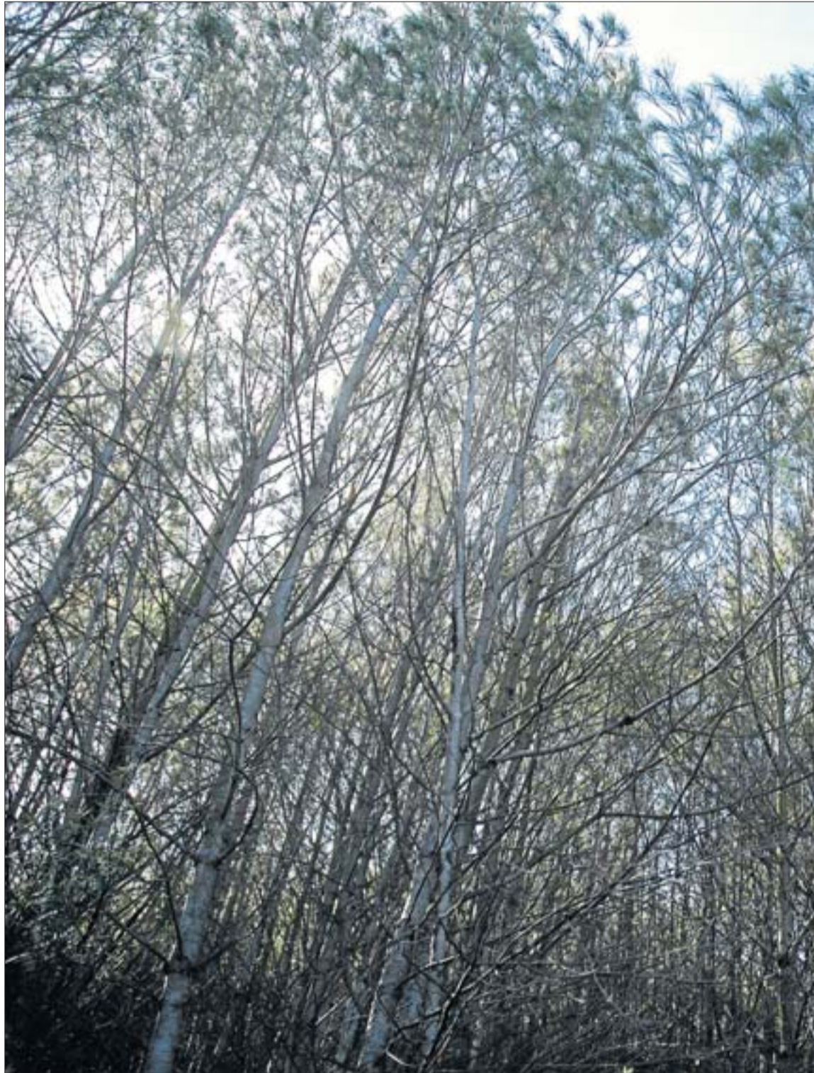
La densitat d'arbres als boscos que s'han regenerat i no s'han cuidat és tan elevada que els fa impenetrables

Als boscos joves i superpoblats, com és el cas dels que es van cremar als anys 80 i 90, extreure'n fusta no és rendible, ja que cal tallar-hi molts arbres, la majoria